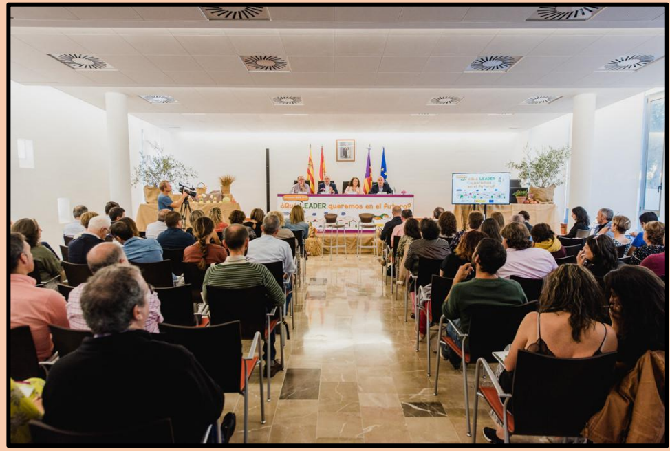
PRESENTACIÓN DE PROGRAMA LEADER