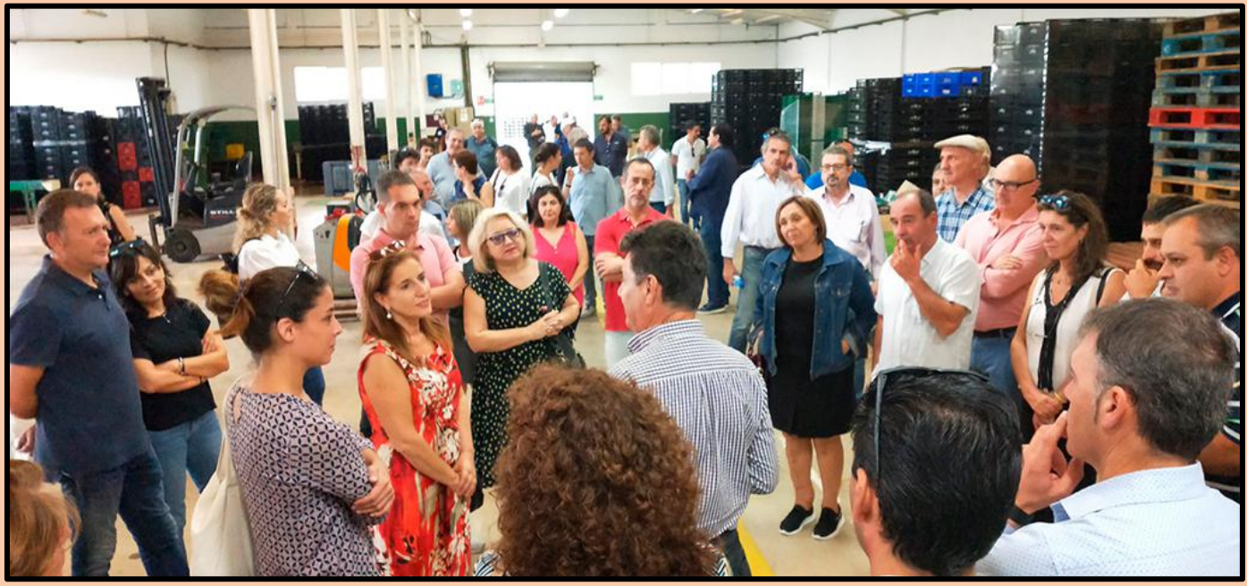
VISITA A UN VIVERO DE EMPRESAS